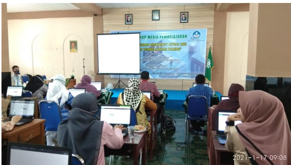
Gambar 6. Pelatihan hari kedua peserta guru-guru

Selanjutnya di hari kedua atau hari terakhir, kegiatan dikhususkan untuk pelatihan pengenalan dan pembelajaran Office 365 pada para guru. Jumlah peserta dari guru yang terdaftar sebanyak 40 orang guru. Materi yang disampaikan adalah materi lanjutan dari hari pertama yaitu one note, sway, dan team. Tampak pada Gambar 6.