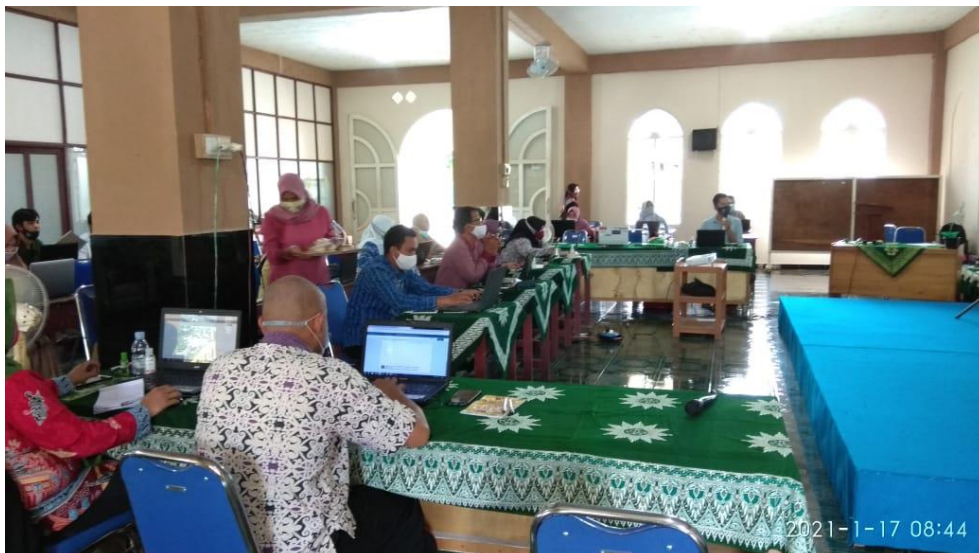
Gambar 2. Pelatihan hari pertama

Kegiatan Pengabdian Kepada Masyarakat ini mengambil tema : "Pengenalan dan Pembelajaran Microsoft Office 365", diselenggarakan selama 2 (dua) hari yaitu tanggal : 16 dan 17 Januari 2021 bertempat di Auditorium SD Aisiyah Kasongan, Kabupaten Katingan diikuti oleh sebanyak 40 orang guru SD Aisiyah Kasongan (daftar peserta terlampir). Hari pertama tanggal 16 Januari 2021 pelatihan diperuntukan untuk guru tampak pada gambar 2. pelatihan dimulai pukul : 7.30 WIB dan berakhir pukul : 15.30 WIB.