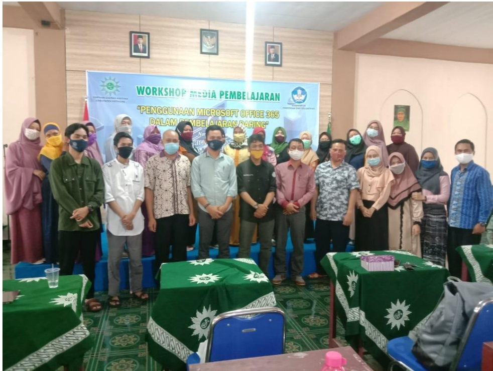
Gambar 5. Foto bersama seluruh peserta

Selanjutnya di hari kedua atau hari terakhir, kegiatan dikhususkan untuk pelatihan pengenalan dan pembelajaran Office 365 pada para guru. Jumlah peserta dari guru yang terdaftar sebanyak 40 orang guru. Materi yang disampaikan adalah materi lanjutan dari hari pertama yaitu one note, sway, dan team. Tampak pada Gambar 6.