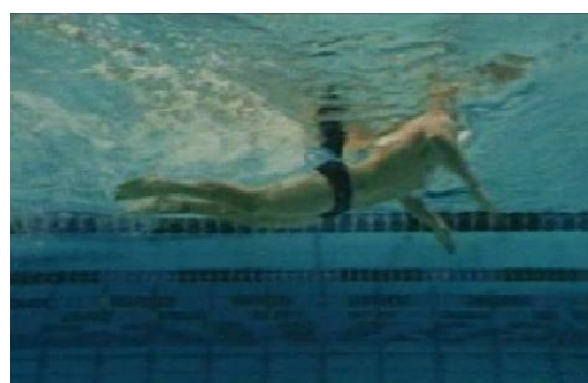
Gambar 5 Gerak Dasar Rotasi Tangan

Dapat kita lihat pada gambar di bawah ini :