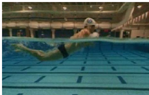
Gambar 4 Koordinasi Gerakan Kaki dan Pernafasan (Sumber : Modul Renang, 2011:110)

Saat kedua kaki melakukan proses menginjak dan menendang hingga lurus ke belakang, kepala diangkat ke atas permukaan air untuk mengambil udara dan selanjutnya kepala masuk ke permukaan air ketika kedua kaki ditarik mendekati pinggul (saat melakukan fase istirahat).