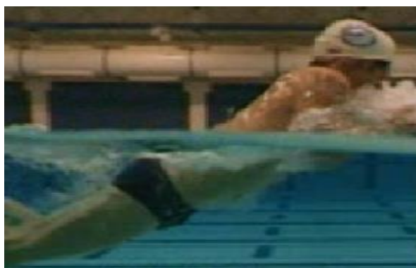
Gambar 3 Breathing

Untuk memperoleh gerakan pernafasan yang baik pada gaya dada, cukup dikombinasikan dengan gerakan kaki.