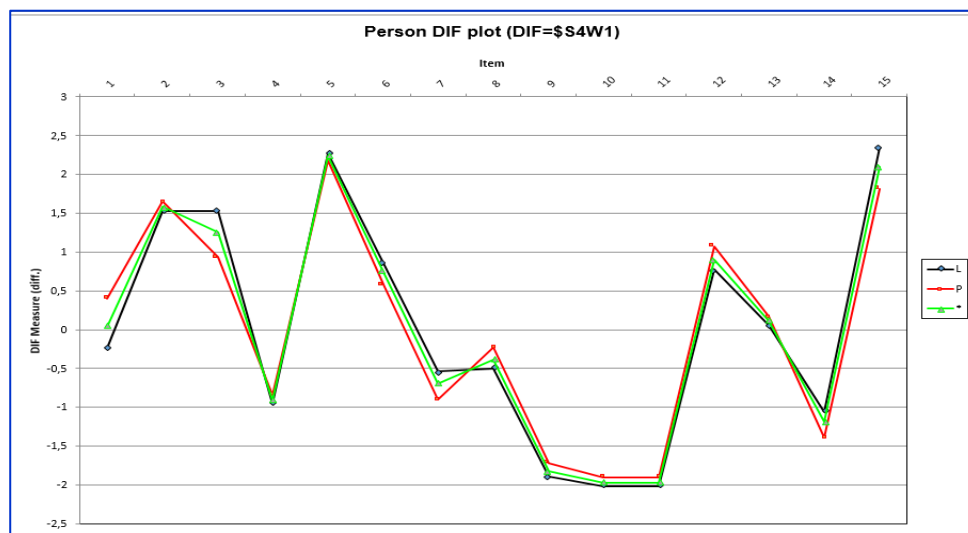
Gambar 6. Plot DIF Bias Gender pada Signifikansi Item Jawaban

DIF digunakan untuk menilai apakah suatu item bekerja secara adil di berbagai kelompok peserta berdasarkan karakteristik tertentu. Sebagian besar item dalam tabel memiliki nilai probabilitas yang cukup tinggi ( > 0.05 ) pada kolom Chi-Square, menunjukkan tidak ada perbedaan signifikan dalam fungsi item di antara kelompok peserta. Namun, Item1 memiliki nilai probabilitas 0.0472, yang berada di bawah 0.05, mengindikasikan potensi bias DIF (Wahyuni, 2022). Pada kolom Between-Class MEAN-SQUARE dan t-ZSTD, Item 1 menunjukkan nilai t-ZSTD sebesar 1.0800, mendekati ambang batas signifikan ( \pm 2 ), yang memperkuat indikasi bias. Selain itu, tabel detail menunjukkan bahwa Item5 memiliki perbedaan DIF Score Measure signifikan antara kelas L (-1.53) dan kelas P (2.18), yang menunjukkan bahwa peserta di kelas perempuan memiliki peluang lebih besar untuk menjawab item ini dengan benar dibandingkan kelas laki-laki.