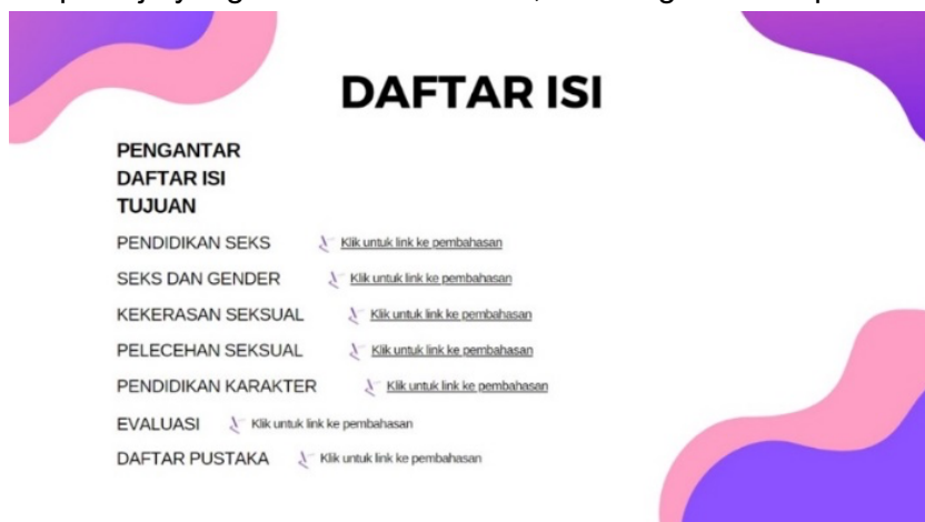
Gambar 3. Daftar Isi