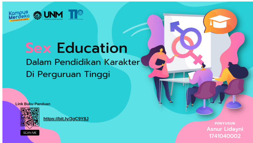
Gambar 1. Sampul Depan