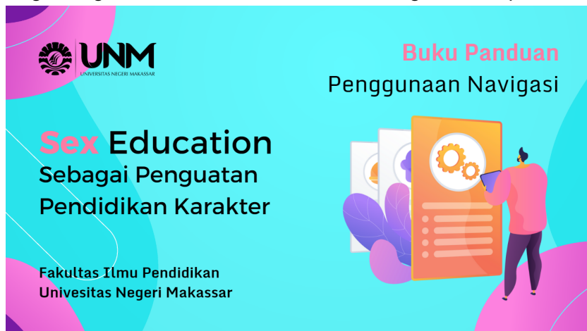
Gambar 2. Buku Panduan