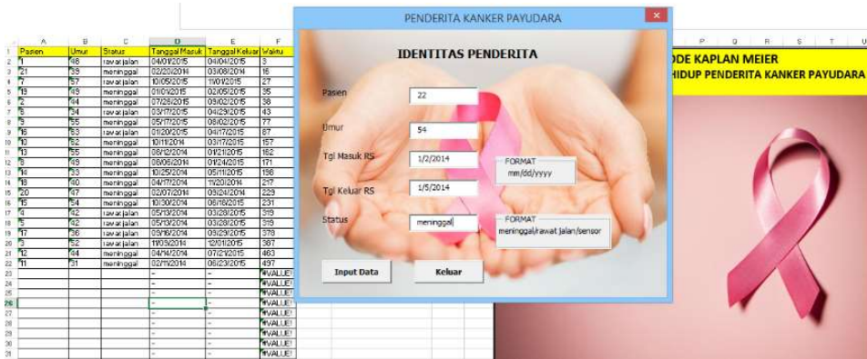
Gambar 4. Implementasi Program Aplikasi Metode Kaplan Meier

Pada subbab ini dibahas mengenai implementasi program metode Kaplan Meier untuk penentuan probabilitas ketahanan hidup. Ilustrasi implementasi program metode Kaplan Meier ini menggunakan data pasien kanker payudara dengan tingkat stadium IV. Dengan menekan tombol ‘masukkan data’ pada program maka akan muncul form baru berisi identitas penderita seperti yang ditunjukkan oleh Gambar 4.