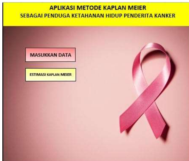
Gambar 1. Tampilan Utama Program Aplikasi Kaplan Meier

Untuk melihat tampilan program aplikasi langkah yang harus dilakukan adalah buka file excel yang telah dibuat form penginputan data penderita kanker payudara.