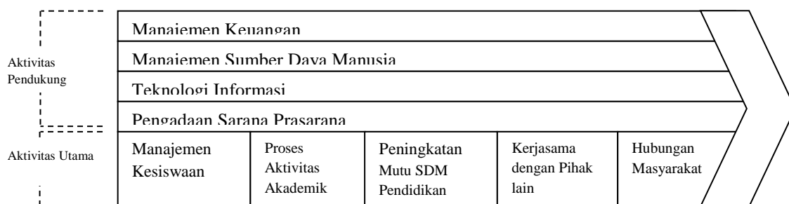
Gambar 2. Rantai Nilai SDIT Fithrah Insani (Sumber : Rencana Strategis SDIT Fithrah Insani 2010-2015)

Berdasarkan hasil penelitian, terutama harapan para partisipan yang merupakan warga sekolah di SDIT Fithrah Insani, dalam perancangan sistem informasi yang dibutuhkan, harus memperhatikan persyaratan suatu disain sistem yang baik, di antaranya : (1) sistem harus berguna, mudah dipahami, dan nantinya mudah digunakan, (2) sistem harus dapat mendukung tujuan utama kegiatan pengelolaan sekolah sesuai dengan prinsip-prinsip pengelolaan sekolah yang baik, (3) sistem harus efisien dan efektif untuk dapat mendukung pengolahan transaksi, pelaporan manajemen dan