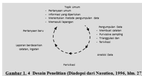
Gambar 1. 4 Desain Penelitian (Diadopsi dari Nasution, 1996, hlm. 27)