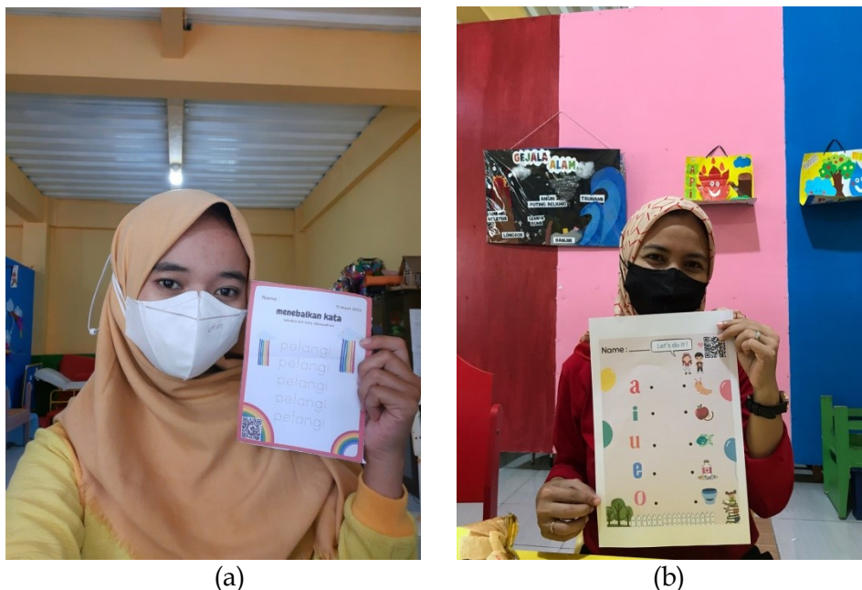
Gambar 7. (a) Hasil cetak worksheet QR menebakkan kata pelangi; (b) Hasil cetak worksheet QR menghubungkan huruf dengan gambar (Dok. Pribadi, 25/02/2022)

pelatihan ini, guru merasa sangat terbantu terutama saat melewati beberapa tahapan pembuatan worksheet QR code sendiri sebagai bukti telah terlaksananya kegiatan pelatihan ini.