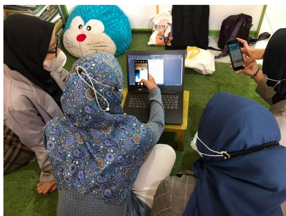
Gambar 3. Dokumentasi proses percobaan

Tindak lanjut dari tahap pengenalan yaitu dengan mencoba aplikasi Canva. Pada tahap percobaan ini, hal yang dilakukan yaitu guru-guru mencoba bermain-main dengan aplikasi Canva yang disediakan oleh tim. Dengan mencoba, guru mendapat gambaran mengenai worksheet yang dirasa efektif diterapkan pada kegiatan pembelajaran untuk anak sesuai usia dan kebutuhan. Peserta dapat mengeksplorasi lebih banyak lagi template yang akan digunakan untuk pembuatan media worksheet . Setelah percobaan bermain-main pada aplikasi Canva, selanjutnya guru mencoba membuat audio atau mereka suara di platform Vocaroo yang kemudian dijadikan kode QR sehingga bisa dimasukkan pada worksheet di Canva dengan format PNG/JPG (Gambar 3).