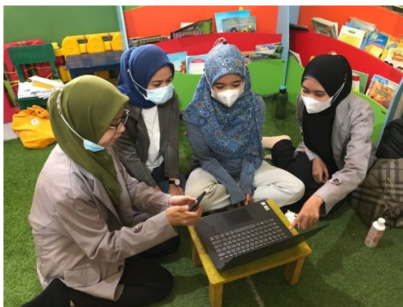
Gambar 2. Dokumentasi proses pengenalan (Dok. Pribadi, 24/02/2022)