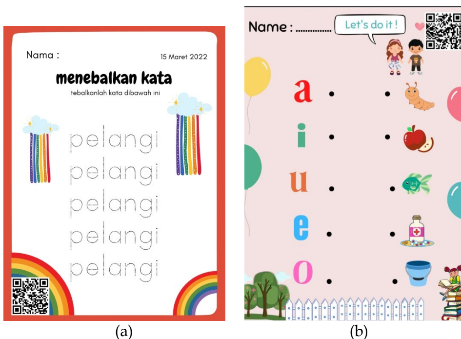
Gambar 6. (a) Hasil desain worksheet QR menebalkan kata pelangi; (b) Hasil desain worksheet QR menghubungkan huruf dengan gambar

Di era abad 21 ini perkembangan teknologi informasi dan komunikasi semakin cepat, sehingga guru perlu mengembangkan kemampuannya dalam menggunakan teknologi digital yang ada. Jika guru dapat berinovasi dalam pembelajaran, maka akan menciptakan suasana kelas yang kondusif karena minat dan motivasi belajar peserta didik tidak akan berkurang. Berdasarkan tahapan pelaksanaan kegiatan yang telah disampaikan oleh Tim pengabdian terkait pembuatan media pembelajaran audio-visual berupa worksheet QR code dengan menggunakan aplikasi Canva dan Vocaroo dapat menjadi mudah dan menarik bila digunakan saat proses pembelajaran berlangsung.