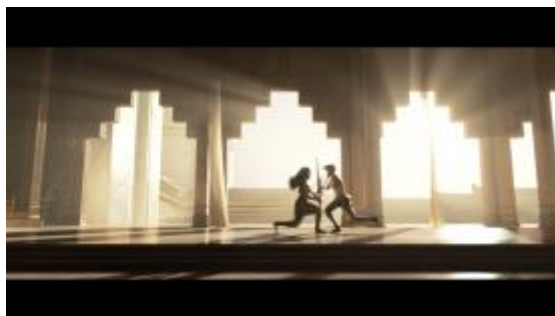
GAMBAR 12. Menit 1:19:28

gamelan. Wayang juga sudah diakui UNESCO sebagai warisan mahakarya dunia yang tak ternilai dalam seni tutur pada tanggal 7 November 2003.