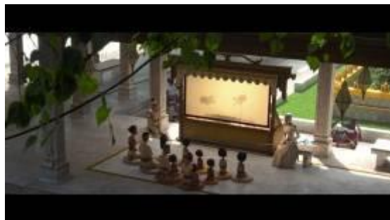
GAMBAR 11. Menit 1:11:26

3. Interpretan: Penulis mengidentifikasi adegan tersebut berdasarkan unsur kebudayaan berupa sistem religi. Bangunan tersebut merepresentasikan dari candi. Di Indonesia banyak sekali ditemukan candi dan masih banyak yang belum terungkap asal-usulnya. Candi merupakan bangunan peninggalan dari peradaban Hindu-Budha sebagai ritual tempat ibadah. Candi di Indonesia yang terkenal adalah candi Borobudur. Candi Borobudur merupakan candi Budha yang terletak di Magelang, Jawa Tengah, Indonesia. Candi Borobudur ditetapkan sebagai warisan dunia oleh UNESCO pada tahun 1991.