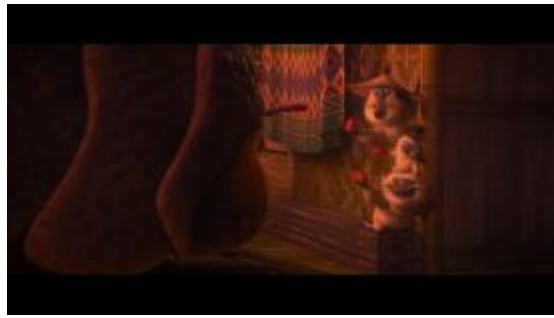
GAMBAR 8. Menit 45:02