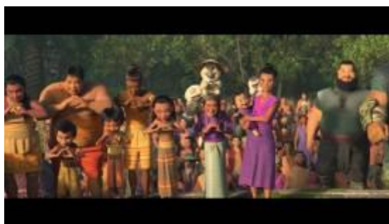
GAMBAR 14. Menit 1:34:08