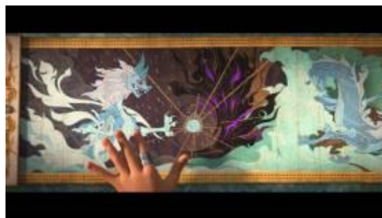
GAMBAR 5. Menit 14:12