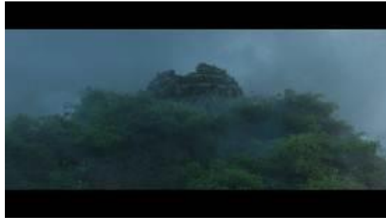
GAMBAR 10. Menit 1:07:13