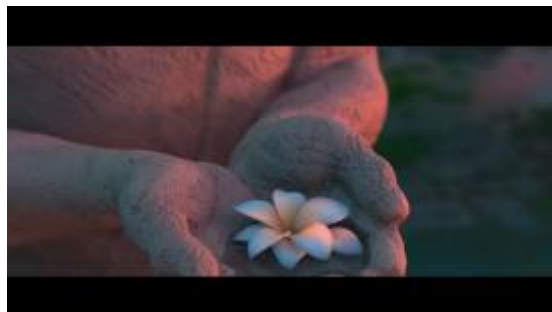
GAMBAR 7. Menit 1:10:00

3. Interpretan: Penulis mengidentifikasi adegan tersebut berdasarkan unsur kebudayaan berupa organisasi sosial dan sistem religi. Indonesia memiliki tradisi atau kebiasaan melepas alas kaki pada tempat-tempat yang dikeramatkan, tempat ibadah, bahkan dirumah sendiri. Hal ini untuk menghormati suatu tempat agar tetap bersih dan suci.