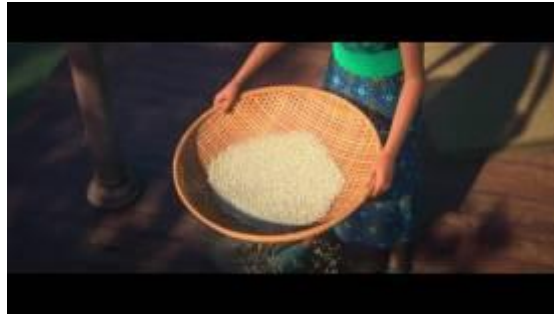
GAMBAR 2. Menit 08:19