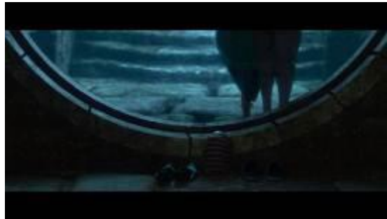
GAMBAR 6. Menit 15:20

permintaan pasar. Batik sendiri merupakan salah satu warisan budaya Indonesia yang diakui oleh UNESCO pada 2 Oktober 2009.