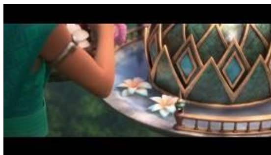
GAMBAR 1. Menit 08:17

“Raya and the Last Dragon” dari Walt Disney Studios Motion Pictures adalah sebuah film animasi petualangan fantasi yang disutradarai oleh Don Hall, Carlos López Estrada, Paul Briggs dan ditulis oleh Qui Nguyen, Adele Lim, dan Paul Briggs. Film animasi ini dirilis di bioskop Amerika Serikat pada tanggal 5 Maret 2021. Secara bersamaan film ini tersedia di Disney+ Premier Access sebagai akibat dari efek pandemi COVID-19 di bioskop. Film yang berdurasi 1 jam 54 menit ini animasi ini menceritakan seorang putri bernama Raya yang mencari naga terakhir dengan harapan dapat mengembalikan permata naga yang hancur, dan mengembalikan ayahnya yang menjadi batu akibat roh jahat yang dikenal sebagai Druun.