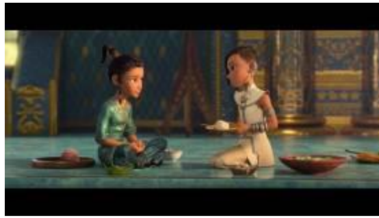
GAMBAR 4. Menit 13:15