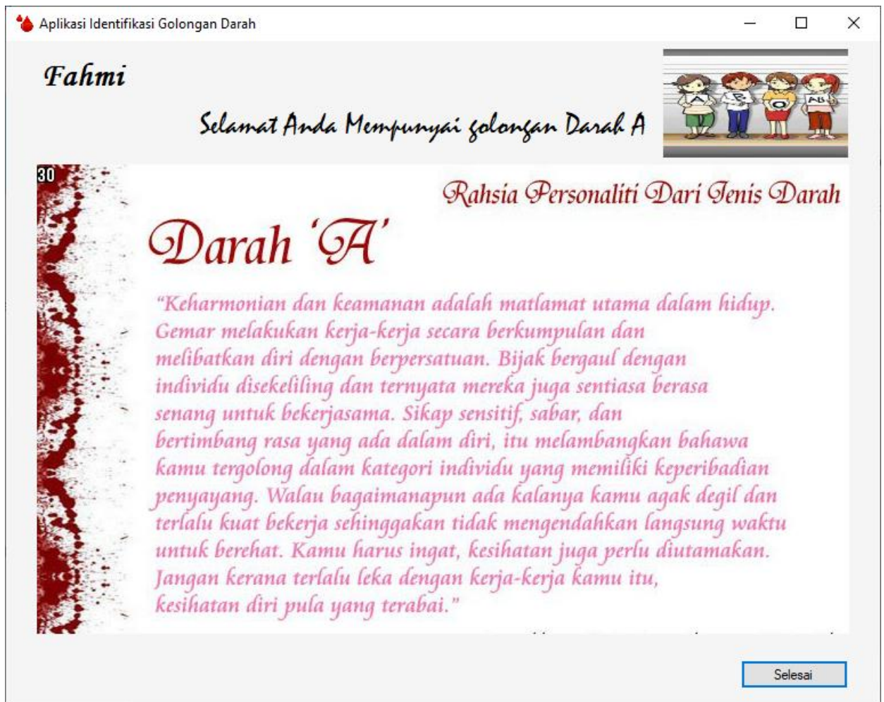
Gambar 10. Hasil Prediksi Golongan darah

Setelah mengisi semua form, maka hasil yang akan ditampilkan pada aplikasi ini adalah sebagai berikut.