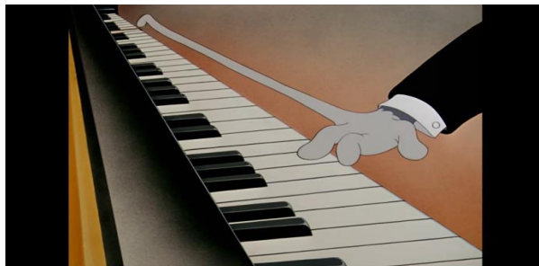
Gambar 12. Jari Kelingking Tom Memanjang (Foto: screenshot youtube menit 4:00, detik 43.