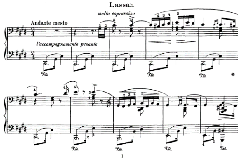
Gambar 3. Partiture lagu The Hungarian Rhapsody No.2