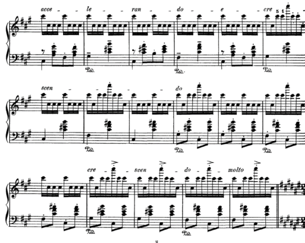
Gambar 11. Partiture lagu The Hungarian Rhapsody No.2 Sumber: Pada menit 4:00, detik 43, dalam episode The Cat Concerto

Pada adegan tersebut, lagu mengalami transisi tempo dari lassan menjadi friska , istilah friska section yaitu memainkan lagu tersebut dengan tempo yang cepat dan bernada gembira. Friska Section menggunakan harmoni dominan yang mana memberikan perasaan kegelisahan karena secara perlahan lagu membangun sesuatu yang lebih besar. Saat Tom terbentur oleh music stand , pacing lagu dan episode mulai sedikit cepat dan suasana menjadi energik.