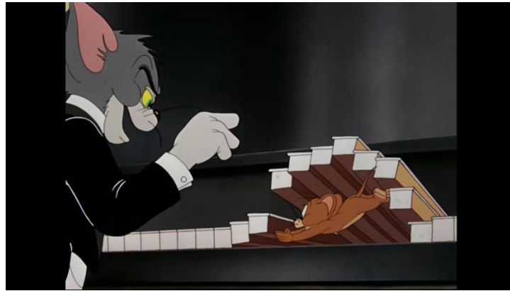
Gambar 8. Jerry Bergerak Secara Acak (Foto: screenshot youtube menit 2:00, detik 55. Sumber: youtube.com/watch?v=QGMpHVyz62Y).

Melihat Tom yang sedang bermain piano dengan rapih, Jerry mencoba untuk mengganggu permainannya. Tom tidak menghiraukan Jerry, hingga dia menekan satu tuts piano beberapa kali dan memukul Jerry secara bersamaan. Karena panik, Jerry berlarian sembari memainkan tuts piano dengan mengikuti arah gerakannya. Dalam adegan tersebut, alunan lagu yang acak-acakan dengan pergerakan Jerry yang serupa sinkron dengan ciptaan naratif yang terkesan berantakan.