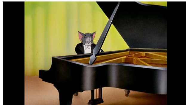
Gambar 4. Tom Bermain Intro Lagu

Lagu mulai diharmonisasikan dengan menggabungkan akord dengan tempo bervariasi, Tom mulai memainkan lagu dengan sangat ekspresif. Alunan lagu menjadi melodis, nada yang dimainkan berulang dari rendah ke tinggi. Wajah Tom memperlihatkan sedikit senyum dan berubah menjadi gusar dengan singkat. Sementara itu, dalam tubuh piano terlihat Jerry sedang tertidur pulas berjalan dengan alunan lagu yang masih bernada lemah. Saat lagu bernada cepat, Jerry terbawa dengan arus senar treble yang berombak dan terbangun.