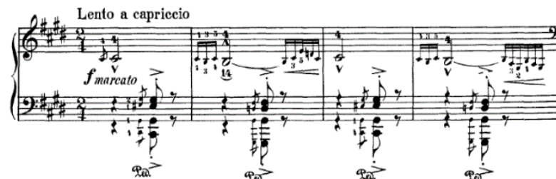
Gambar 1. Partiture lagu The Hungarian Rhapsody No.2 Sumber: Pada menit 1:00 detik 05, dalam episode The Cat Concerto

Kartun ini diawali dengan Tom membuka acara dengan membawakan lagu klasik The Hungarian Rhapsody No.2 karya Frans Lizst. Lagu dibuka dengan Tom memainkan tangan nada Db serta F Mayor dengan tempo lambat, lagu tersebut dipadukan dengan musik orkestra. Gerakan yang ditimbulkan memperlihatkan Tom memainkan intro lagunya dengan emphasis .