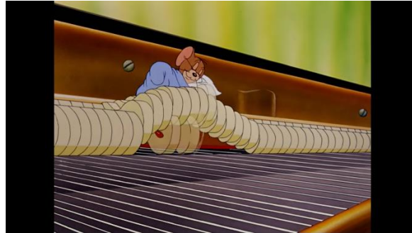
Gambar 6. Jerry Terbawa Senar Treble

Adegan tersebut ditandai sebagai awal pembangunan konflik antara Tom dan Jerry. Tempo lagu memasuki lassan section yaitu memainkan lagu tersebut dengan serius dan dramatis melalui tempo yang lambat. Section tersebut umumnya digunakan oleh tarian rakyat negara Hungaria yang memiliki nada gelap dan muram. Dalam adegan tersebut, ekspresi dan permainan instrumen yang terlihat dari Tom memberikan suasana gelap dengan alunan lagu melodis tenang. Saat memasuki adegan Jerry tertidur, nada menjadi cepat. Hal ini memberikan pesan yaitu mengganggu aktivitas seseorang menggunakan media lagu.