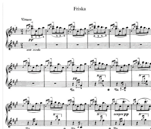
Gambar 9. Partiture lagu The Hungarian Rhapsody No.2

Setelah Jerry menghilang, Tom kembali pada penampilan musiknya. Kini, Ekspresi Tom semakin ceria setelah menaikkan nada lagu tersebut dengan alunan lagu memberikan perasaan tenteram. Tetapi setelah Jerry memukul tangan Tom dengan music stand , alunan lagu dan suasana berubah secara kasar. Konflik antara kedua tokoh kartun tersebut mulai terjadi dengan Tom mencoba untuk mengusir Jerry dari panggung pementasan, secara bersamaan tempo lagu perlahan-lahan menjadi cepat.