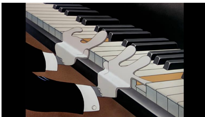
Gambar 10. Tangan Tom Menjadi Pipih (Foto: screenshot youtube menit 3:00, detik 48. Sumber: youtube.com/watch?v=QGMpHVyz62Y

Sumber: Pada menit 3:00, detik 48, dalam episode The Cat Concerto.