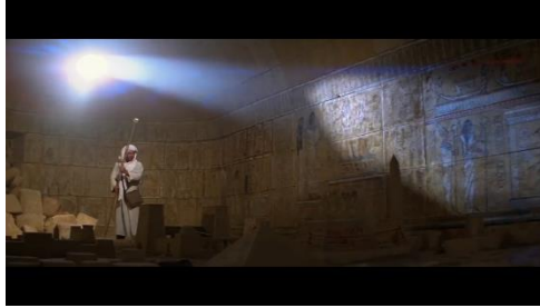
Gambar 4: Potongan Adegan 4 Indy Berada di dalam Kuil

Dalam potongan adegan ini Indy berhasil masuk kedalam sebuah ruang bawah tanah yang berisi relief-relief yang menceritakan kehidupan pada masa Firaun. Makna arkeologis yang terkandung pada adegan ini adalah Relief yang merupakan gambar yang dipahat dalam bentuk ukiran. Serta symbol yang terkandung pada adegan ini adalah indy yang menggunakan kepala tongkat Ra dengan mengadahkan sampai kepala tongkat Ra mengenai sinar matahari dan mengarahkan pada miniatur-miniatur tersebut untuk mengetahui lokasi tepatnya dimana tabut itu disembunyikan.