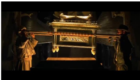
Gambar 6: Potongan Adegan 6 Tabut Perjanjian diangkat dari dalam peti batu

Dalam adegan ini terlihat Sallah dan Indy yang tengah berhasil mengangkat Ark of the Covenant atau Tabut Perjanjian dari dalam peti batu di sebuah kuil bawah tanah. Makna arkeologis pada potongan adegan ini adalah terletak pada Tabut Perjanjian itu sendiri yang berisi sepuluh perintah Tuhan.