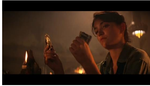
Gambar 2: Potongan Adegan 2 Marion Ravenwood dan Kepala Tongkat Ra

Pada potongan adegan ini terlihat Ravenwood tengah memegang uang pada tangan kiri dan kepala tongkat Ra pada tangan sebelah kanan. Ikon yang terdapat pada adegan ini berupa lilin dan uang, sedangkan untuk makna arkeologis yang terdapat pada potongan adegan ini adalah kepala tongkat Ra yang merupakan sebuah artefak yang dapat menunjukkan lokasi Well of Souls tempat dimana Tabut Perjanjian disembunyikan. Bagi para arkeolog artefak merupakan sebuah tinggalan arkeologis yang memiliki nilai yang begitu tinggi karena bermanfaat untuk merekonstruksi kembali masa lalu.