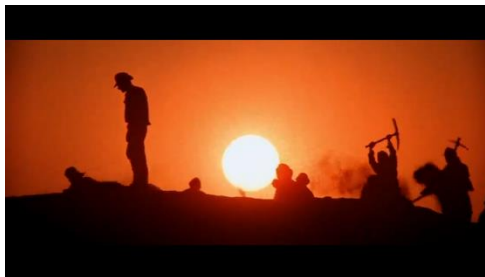
Gambar 5: Potongan Adegan 5 Indy bersama masyarakat setempat

Pada potongan adegan ini terlihat ketika Indy dan Sallah yang membawa beberapa masyarakat setempat untuk membantu Indy dalam Penggalian dimana Tabut Perjanjian itu di sembunyikan. Makna arkeologis dan symbol yang terkandung dalam potongan adegan ini adalah alat yang digunakan untuk penggalian ini merupakan beberapa alat yang digunakan dalam metode ekskavasi atau metode khusus dalam penggalian tinggalan arkeologi.