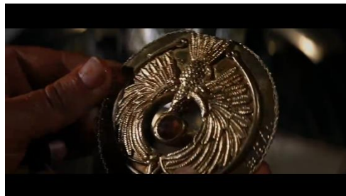
Gambar 3: Potongan Adegan 3 Kepala Tongkat Ra

Terlihat pada potongan adegan ini yaitu kepala tongkat Ra yang tengah diamati dan membaca untuk menemukan lokasi Well of Souls tempat dimana tabut perjanjian disembunyikan. Terlihat motif yang terdapat pada kepala tongkat Ra bermotif burung phoenix serta aksara Yunani yang menjelaskan tempat Tabut Perjanjian tersebut.