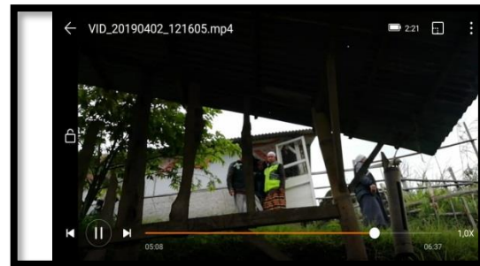
Foto 1 & 2: Dokumentasi video berupa aktivitas solawatan masyarakat sekitar Gunung Batu di Makam Keramat Gunung Batu (Dokumentasi pribadi, direkam pada 2 April 2019)

Saat kami mendatangi makam, kondisi makam terbuka karena ada masyarakat yang solawatan. Berdasarkan informasi dari Bapak Ujang sebagai Juru Kunci, aktivitas tersebut sering dilakukan oleh masyarakat yang menganggap sosok Embah Mangkunagara dan Embah Jambrong sebagai sosok yang dihormati dan diyakini keberadaannya. Berikut adalah foto video dari aktivitas tersebut.