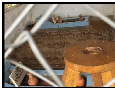
Foto 7: Makam dilihat dari ram kawat (Dokumentasi pribadi, diambil pada 26 Maret 2019)