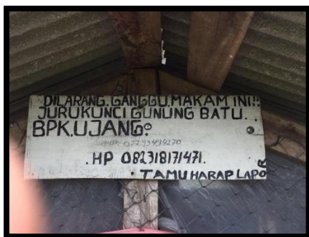
Foto 3: Pengumuman bahwa Pak Ujang ialah juru kunci yang dapat dihubungi