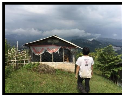
Foto 6: Ruang Makam Keramat Gunung Batu dilihat dari luar (Dokumentasi pribadi, diambil pada 26 Maret 2019)