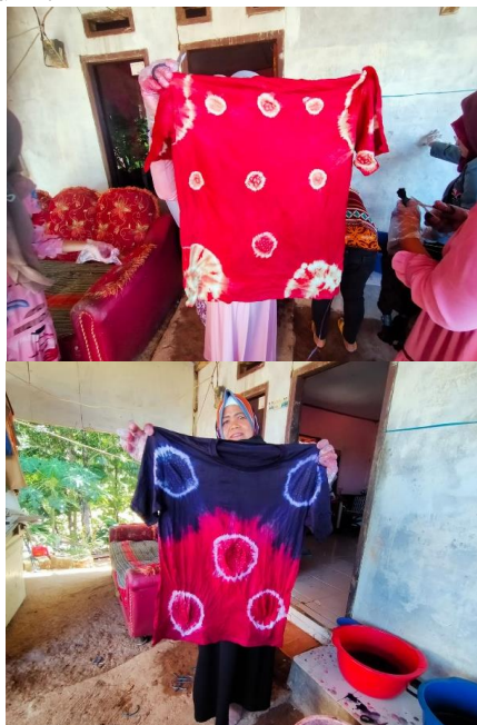
Gambar 3. Produk hanjeli e-dye dengan memanfaatkan buah hanjeli

Pelatihan keterampilan pembuatan kerajinan E Tie Dye Hanjeli merupakan kegiatan pengabdian kepada masyarakat dengan judul “ Hanjeli E-Dye Fabric sebagai Produk Unggulan Industri Fashion Desa Wisata Ciletuh Pelabuhan Ratu Unesco Global Geopark Kabupaten Sukabumi”. Waktu pelaksanaan Action pada tanggal 28 sampai 30 Juni 2022 mulai pukul 08.00 – 16.00 WIB. Sasaran program kader PKK dan masyarakat berjumlah 20 orang, dengan Instruktur 5 (lima) orang dan melibatkan oleh 3 (tiga) orang mahasiswa. Tempat dikegiatan di rumah salah satu kader PKK (ibu Dedeh) Desa Waluran Mandiri Kecamatan Waluran Kabupaten Sukabumi.