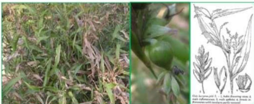
Gambar 1. Tanaman Hanjeli dan ilustrasi

Selain hanjeli, Sumber Daya Manusia di Desa Waluran Mandiri sangat potensial, sebanyak kurang lebih dari 40 orang merupakan anggota PKK dan KWT yang relatif mempunyai potensi waktu luang yang cukup banyak. Faktor pendukung yang terdapat pada khalayak sasaran adalah semangat dan keinginan kuat untuk dapat mengolah dan memanfaatkan tanaman hanjeli yang tidak hanya berupa bahan olahan pangan, tetapi dapat dibuat sebagai alternatif dalam bidang sandang. Mempertimbangkan potensi hanjeli dan hasil survey, terpikirkan oleh tim untuk mengenalkan pemanfaatan hanjeli dalam bidang sandang sebagai alternatif dalam pembuatan motif tekstil dengan teknik E-dye yang diproyeksikan menjadi produk unggulan dan pengembangan kreativitas masyarakat Desa Waluran Mandiri sebagai Desa Wisata kawasan Ciletuh Palabuhan Ratu UNESCO Global Geopark.