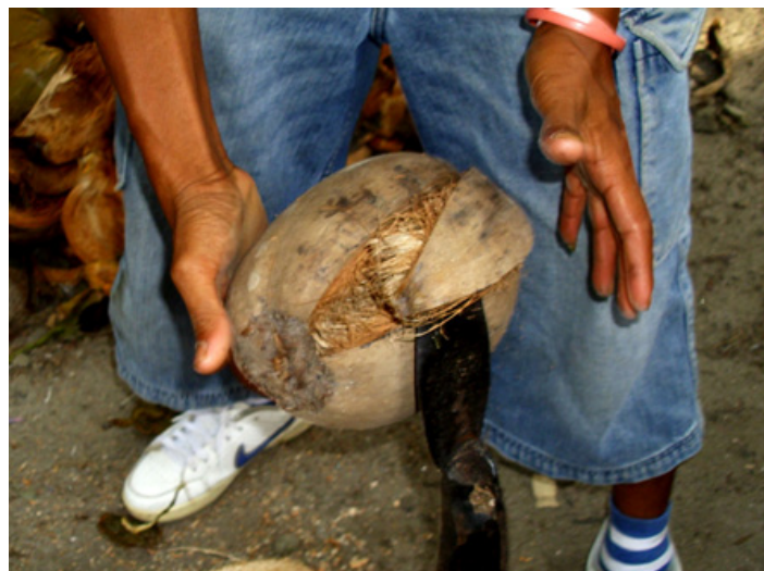
Gambar 1. Mengupas kelapa dengan Linggis (Manual)

Berikut adalah beberapa potret kehidupan Buruh Pengupas Kelapa, Pedagang Kelapa, dan Petani kelapa serta Masyarakat di Cikedung, Indramayu, Jawa Barat: